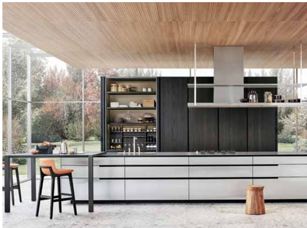
POLIFORM, Phoenix - poliform.it

Preparing, cooking, washing, storing, preserving... The kitchen is a hub that attracts a plethora of skills and every new trend going. Without doubt, it is the most lived-in room in the house. It is also the room that tends to be a showcase for technological advances. Appliances are inspired by the high-tech world. They are becoming smart, connected, more eco-friendly and adopt a design that blends in with the furniture... sometimes making you forget their primary function. ▶