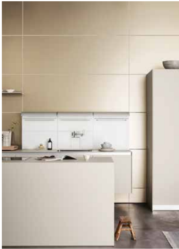
BULTHAUP, b3 system - bulthaup.com