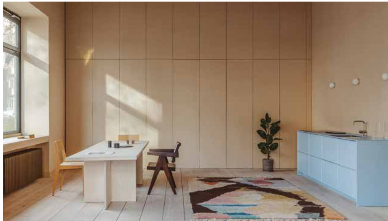
REFORM, Frame Collection in blue - reformph.com © Khuong Nguyen

The grey-white-wood combination and the play of materials are still popular, but in Italy the trend is to team up innovation with pastel colours. Smeg is even going all the way with a capsule collection of colourful electronic appliances, created with Dolce & Gabbana. Yellow was voted colour of the year (a tie with grey) by Pantone in its Illuminating version, which is available in more neutral shades, starting with vanilla. We also confess to a weakness for sky blue, sandy beige, pearl grey and pale green. ▶