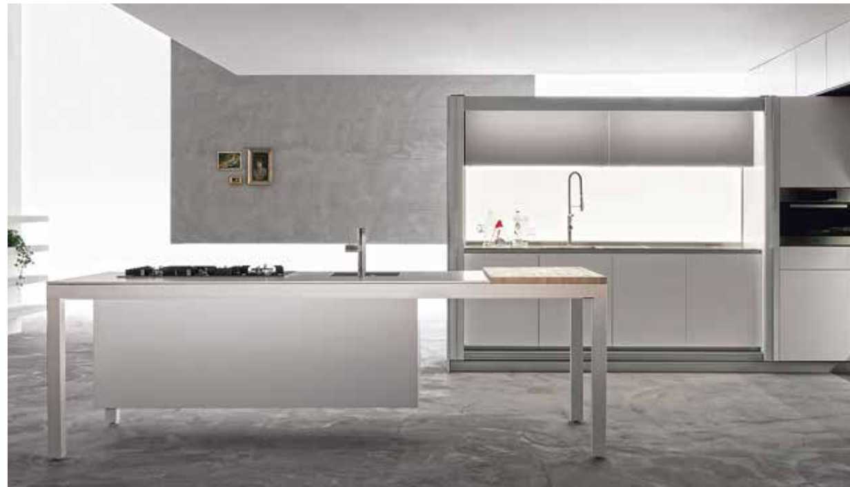
DADA | MOLteni&C, Tivali 2.0 - dada-kitchens.com

Beyond the ideal fusion of wood and natural stone, stainless steel will continue to have a superlative effect in any modern kitchen. By adapting professional kitchens worthy of the greatest chefs to domestic use, designers have succeeded in taming this unalterable, indestructible material, which can be shaped according to your imagination. From kitchen sinks to hood bottoms, credenzas and vast worktops, from storage units to taps and other accessories, the many advantages of stainless steel make it a must-have material in the kitchen. ▷