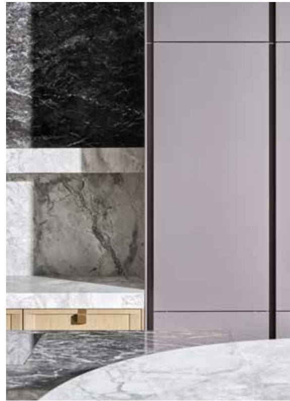
SIEMATIC, Mondial - siematic.com