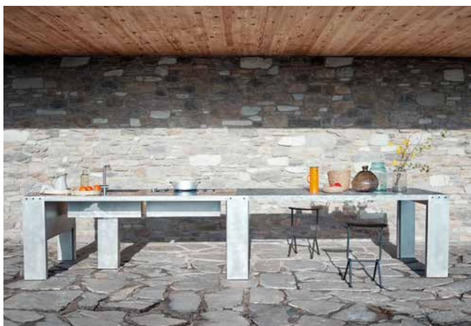
CESAR, Williamsburg Outdoor Kitchen - cesar.it