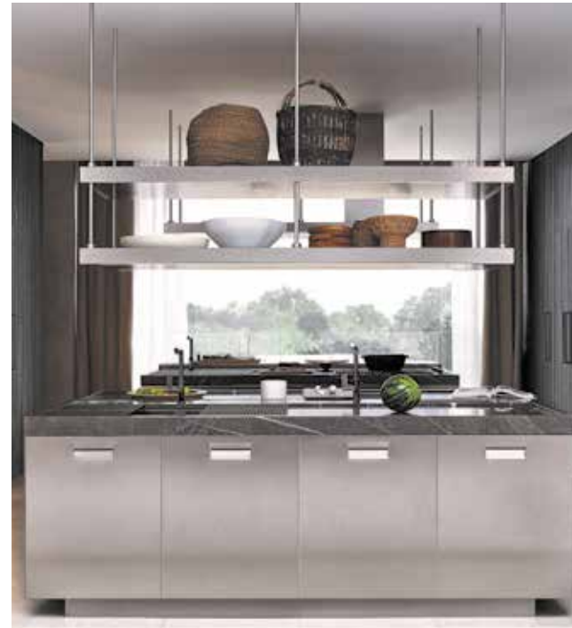
ARCLINEA, Lignum & Lapis by A. Citterio - arclinea.com