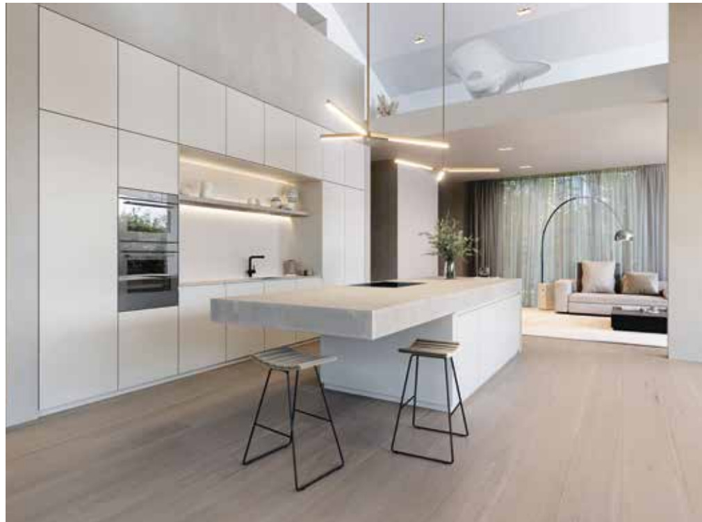
V-ZUG, Comhair 60 V6000 Oven + Combi Steamer 45 V6000 Oven - vzug.com