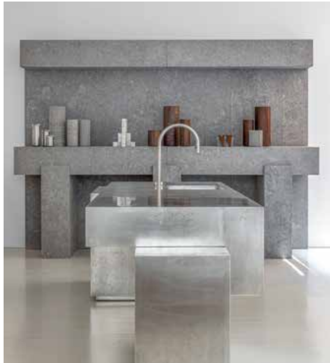
OBUMEX, signature kitchen Nicolas Schuybroek - obumex.be