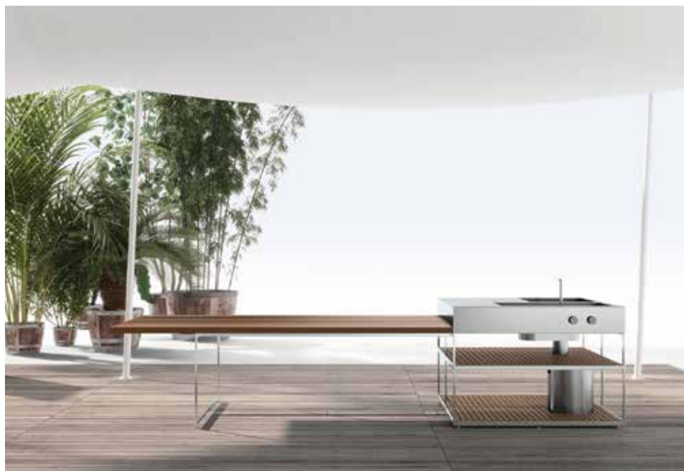
BOFFI, Open Outdoor Kitchen - boffi.com

An outdoor kitchen is the ultimate must-have. As far back as 1963, Joe Colombo designed an outdoor version of a compact mini kitchen on wheels for Boffi. It embodied the marriage between functionality and flexibility. Today's kitchen manufacturers offer extremely streamlined systems that couldn't be further from a barbecue, however sophisticated yours may be. Fitted out with electric hobs, plancha, integrated fridge (60L), fully pull-out drawers, sockets for small appliances, a large wooden worktop and preparation trays, it basically gives you everything you need to cook in your garden. At last, the cook can stay and socialise with the guests! □