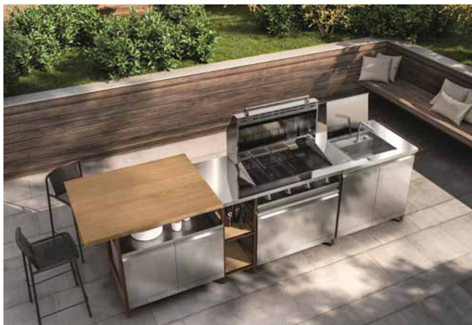
SCAVOLINI, Formalia Outdoor Kitchen - scavolini.com